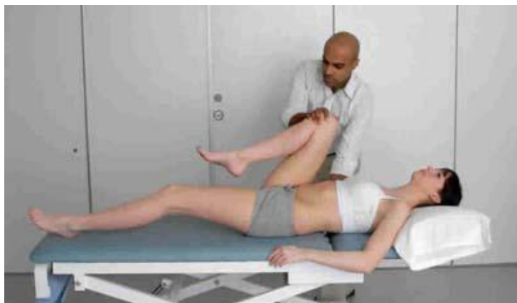
Obrázek 16.2: Demonstrace Thomasova testu, který se používá pro vyšetření deformace pevných flexorů kyčle.