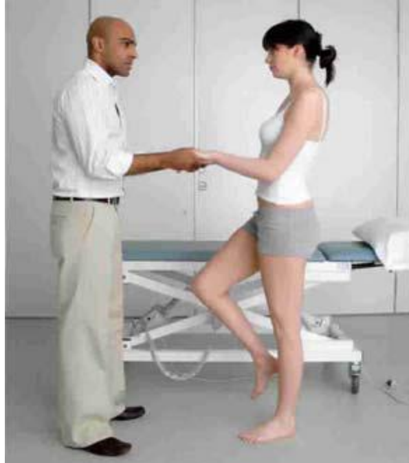
Obrázek 16.1: Demonstrace Trendelenburgova testu.

Test vyjde negativní , pokud se pánev na opačné straně nakloní nahoru (to je normální). Test vyjde pozitivní , pokud se pánev na opačné straně nakloní dolů.