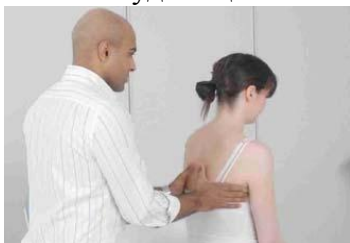
2.2 Сурет: Кеуденің кеңеюін өлшеу (5 см артық болмауы тиіс)