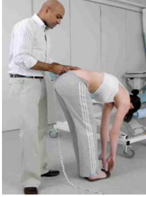
2.4 Сурет: Шробер сынағы: Науқастың омыртқасы иіледі (алға иілу)