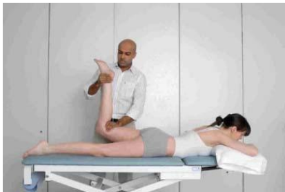
2.8 Сурет: Жамбас нерв жүйесін созылуын тестілеу: жамбасты (сан) созылуы