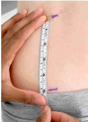
2.5 Сурет: Шробер сынағы: белгілер аралығы 12.5 см

Науқасты отырған күйінде мойын омыртқаны тексеріңіз.