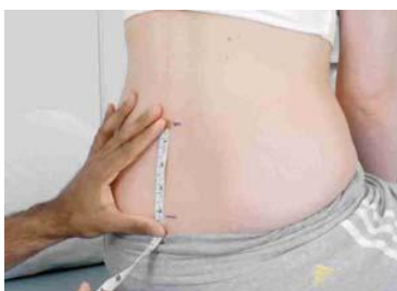
2.3 Сурет: Шробер сынағы: белгі аралығы 10 см

Шробер сынағы: Венера шұңқыры мен одан жоғары жерден арасы 10 см болатындай нүкте белгілеп алыңыз (2.3 сурет).