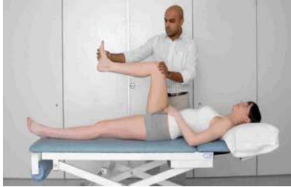
2.7 Сурет: Ласега сынағының көрсетілуі: аяқтар бос, тізе бүгулі