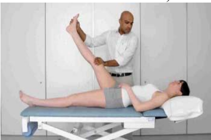
2.6 Сурет: Аяқты тікке көтеріледі, жіліншік артқа бүгіледі